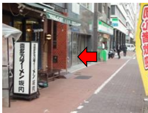
2. ここがTODA BUILDING宝町です