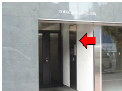
3. このインターフォンで「601」を押して ください。