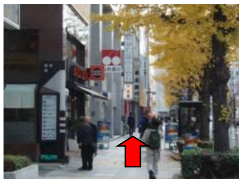
1. 京橋駅4番出口を出たら直進(150m)