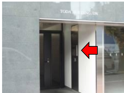
4. このインターフォンで「601」を押してください。