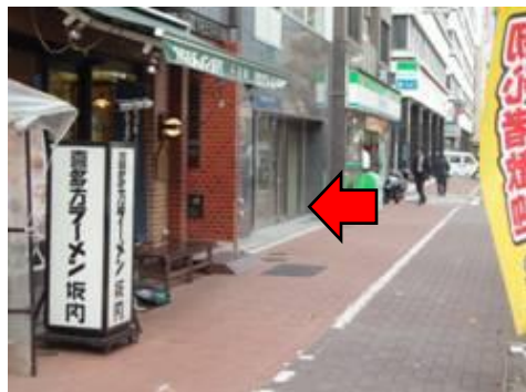
3. ここがTODA BUILDING宝町です